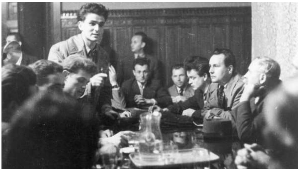
Kép: Parlamenti szoba 1956. október 23-án, a társaság jobb szélén Veres Péter, az írószövetség elnöke